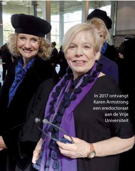
In 2017 ontvangt Karen Armstrong een eredoctoraat aan de Vrije Universiteit

In het Westen zijn we er in onze tijd van overtuigd geraakt dat het mis gaat zodra religie en politiek vermengd raken, schrijft Armstrong in haar boek Fields of Blood . Karen Armstrong stelt vragen bij de koppeling tussen religie en geweld. Ze vraagt zich af hoe het komt dat we geloof zijn gaan bekijken als een privézaak. Ze is kritisch op de westerse voorkeur voor secularisme. Volgens Armstrong maakt dat ons blind voor staatsgeweld en ook voor de verbindende krachten van religie. Het Handvest voor Compassie kwam tot stand nadat Armstrong in 2008 een van de drie TED-prijzen had gewonnen. Met het prijzengeld nam ze het initiatief om samen met leiders en grote denkers uit alle wereldreligies de inmiddels wereldwijd ondersteunde Charter for Compassion te schrijven, dat op 12 november 2009 in 32 landen werd gelanceerd. Dit handvest, een tekst op basis van de