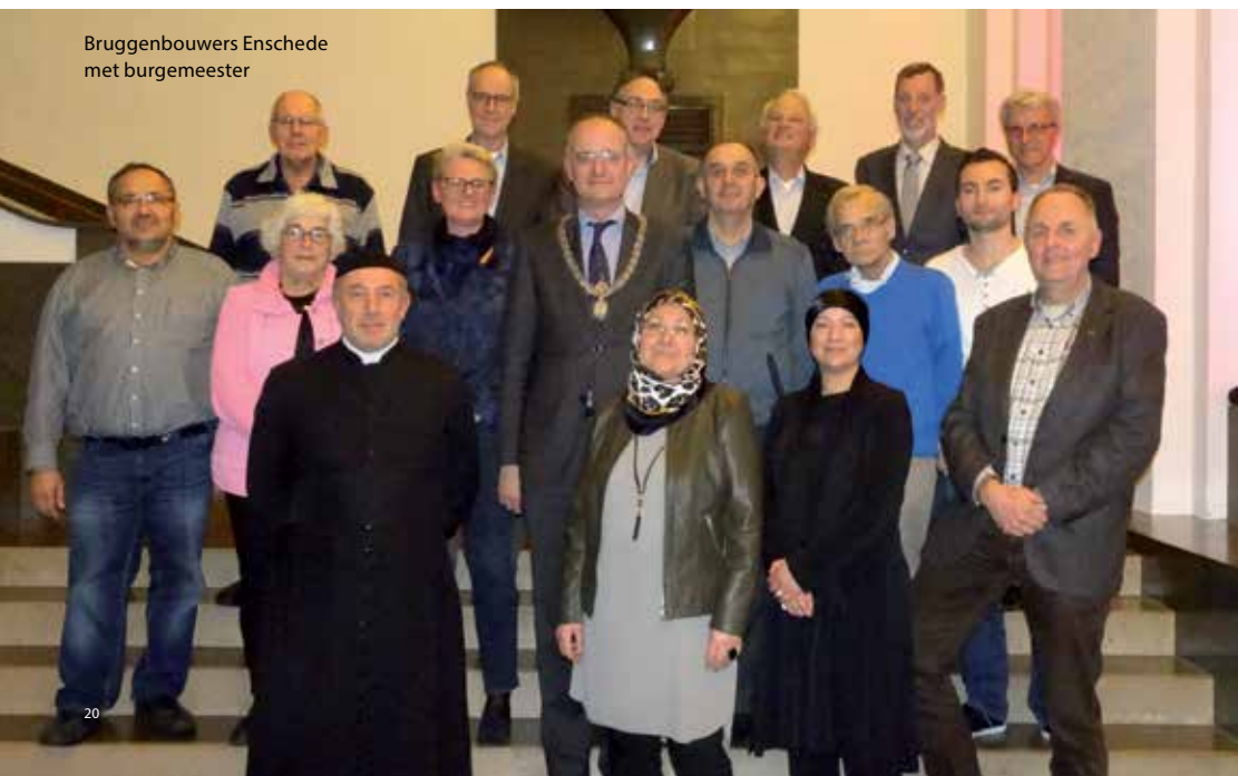
Bruggenbouwers Enschede met burgemeester